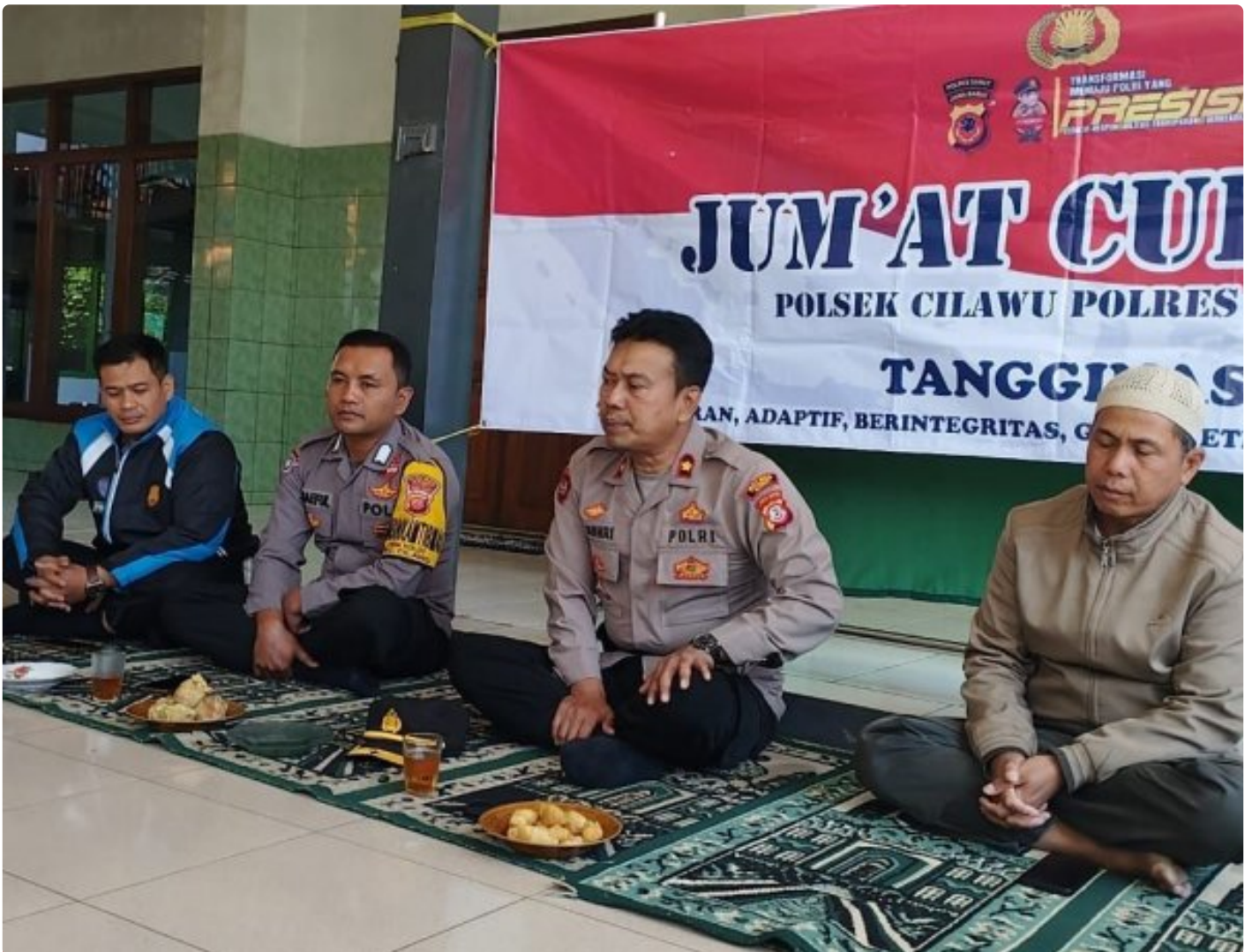
Kapolsek Cilawu mendengarkan curhatan warga